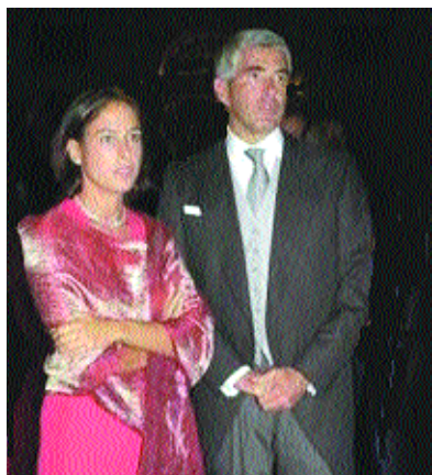
Il presidente della Camera Pierferdinando Casini con Azzurra Caltagirone. In alto, Paolo Cirino Pomicino e, a destra, Marco Demarco. Sotto, Michele Santoro e, nella foto piccola del titolo, Mario Orfeo.

ne distaccata di Pozzuoli e poi alla Cultura. Dalla compagine dei duri e puri si defila ben presto Enzo Ciaccio , inviato della Grande Napoli, che col capo della cronaca Claudio Scamardella e col redattore economico Angelo Iaccarino , dalla linea dura passa a quella dell'attesa: non sfiduciare subito Orfeo ma tenerlo sulla graticola, nella speranza di spuntare maggiore attenzione alle esigenze interne alla redazione.