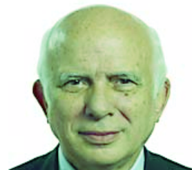
Paolo Cirino Pomicino

ro alla terza corsia. «Che poi di bombe è proprio il caso di parlare, perché come è successo allora, ancora oggi succede lungo i cantieri della Napoli Reggio Calabria - rivela un tecnico - quando ogni tanto scoppia un ordigno. Tanto per far sapere che la zona qui la controllo io, che il movimento terra va a queste ditte, le assunzioni ve le diciamo noi. Non c'è chilometro dell'autostrada che non sia sotto l'assoluto controllo di questo o quel clan». E allora, la terza corsia fu una vera manna per "subappalto selvaggio", con una sfilza d'impresе tutte in chiaro odore di camorra a far man bassa di lavori. Che andavano, appunto, dal movimento terra, alle cave, al pietrisco. Tutte regolarmente in ottimi rapporti con politici locali, e non solo. Alcune sono al lavoro ancora oggi. E possono contare su un certificato antimafia immacolato.